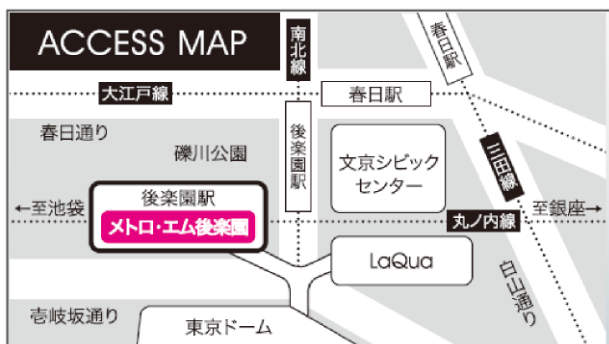
■メトロ・エム後楽園1階 MAP