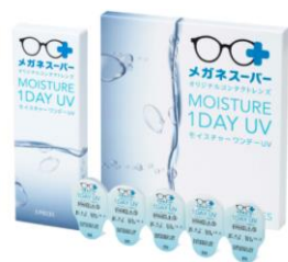
MS MOISTURE 1DAY UV