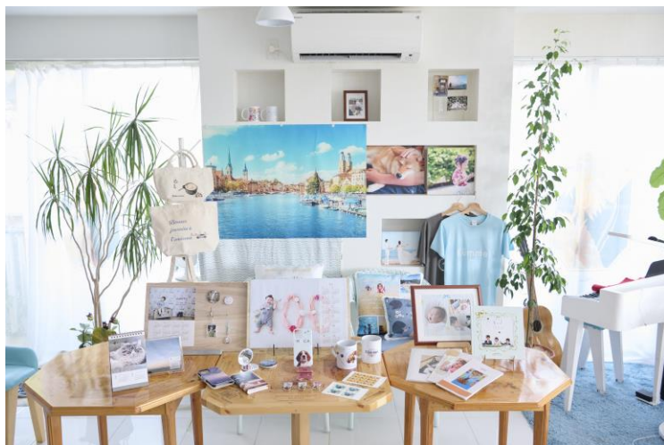
PHOTO & DIGITAL SERVICE PHOTO GIFT