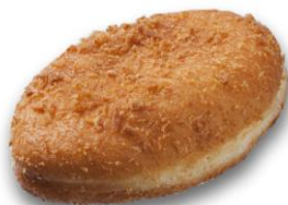
シェフのカレーパン