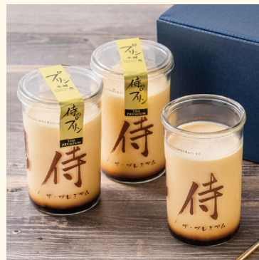
侍のプリン ザ・プレミアム 730円（税込）

プリン本舗の一番人気！ 秘伝のほろ苦カラメルが、甘さ控えめのプリンのを引き立てます。