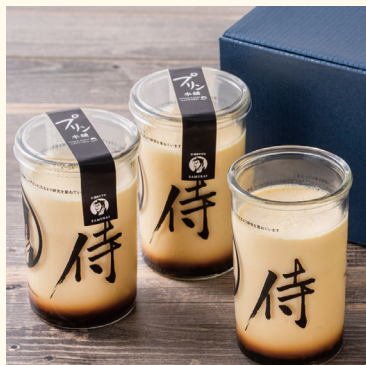
侍のプリン 570円（税込）

記念すべきひと月目の店舗は「侍のプリン」が大好評の「プリン本舗」です。今後も季節に合わせて、全国各地からとっておきのスイーツブランドをお届けしていく予定です。