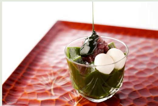
やまりゼリー 560円（税込）

宇治の石臼挽き抹茶を贅沢に練り込んだクリームを、職人が一枚一枚丹念に焼き上げた生地ではさみました。