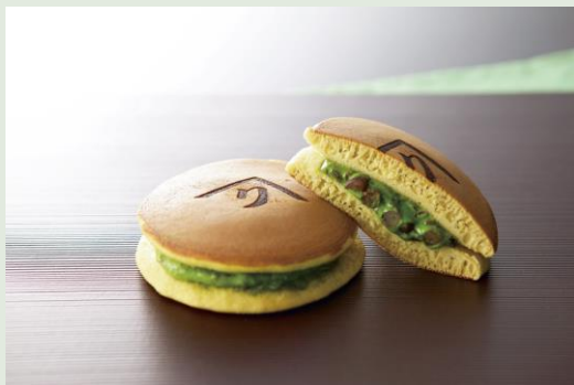
宇治抹茶どら焼き 1個 374円（税込）

今後も季節に合わせて、全国各地からとっておきのスイーツブランドをお届けしてまいります。