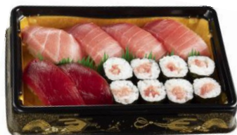
天然インド鮭づくし 1,250円（税込）