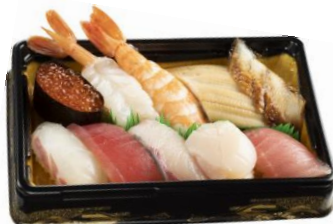
上にぎり盛り合わせ10貫 1,280円（税込）