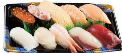
にぎり盛り合わせ10貫 690円（税込）