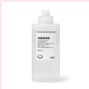
食器用洗剤 250mL 399円（税込）