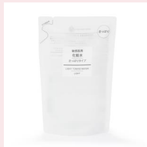
化粧水 敏感肌用 さっぱりタイプ 200mL/リフィル 490円（税込）