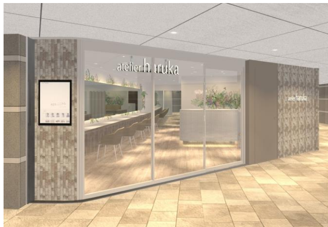
店頭写真はイメージです