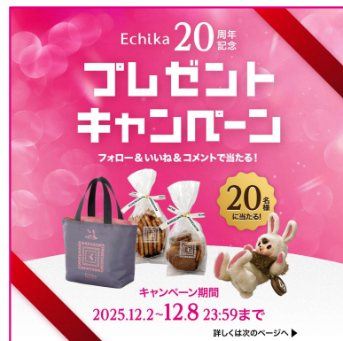
▲ Instagramキャンペーンページ