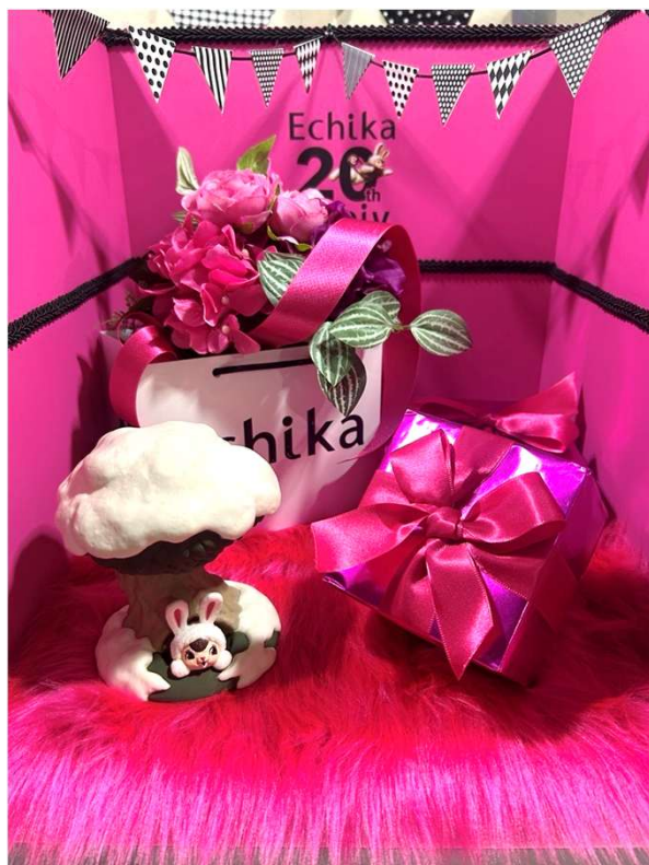
▲エチカちゃん ぬい撮りフォトブース

東京メトロ駅構内店舗および商業施設の企画・開発・運営管理、リテール事業を行う株式会社メトロプロパティーズ（本社：東京都台東区、代表取締役社長：黒須良行）が運営する「Echika表参道」が、 2025年12月2日 に開業20周年を迎えました。これを記念して、12月2日から表参道駅にぬい撮りフォトブースが登場します。エチカちゃんと一緒にEchika20周年をお祝いしましょう！