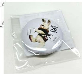
▲ 20周年限定缶バッジ