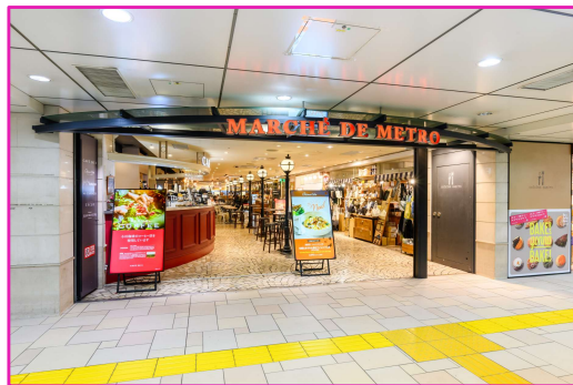
▲ マルシェ・ドウ・メトロ