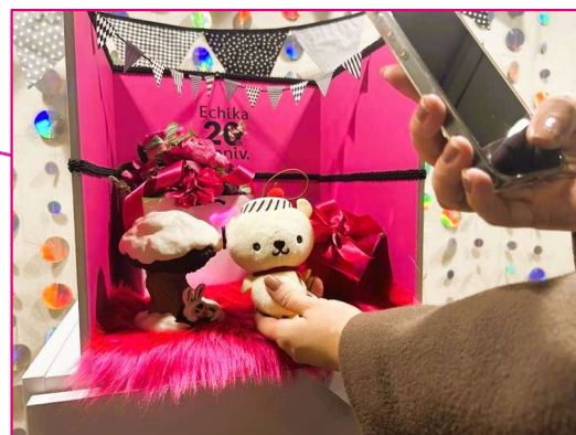
▲お気に入りのぬいと記念撮影