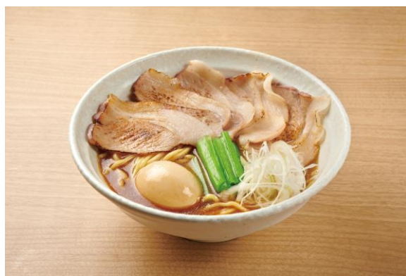
「東京とんこつ」 前田美豚チャーシューメン 1,280円