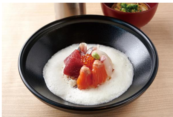
「豊洲直送海鮮丼 五色雲」 豊洲直送やま幸まぐろの五色丼 1,980円

東京メトロ駅構内店舗および商業施設の企画・開発・運営管理、リテール事業を行う株式会社メトロプロパティーズ（本社：東京都台東区、代表取締役社長：黒須良行）が運営する永田町駅構内「 Echika fit永田町 」フードコートの一部が 2024年10月17日（木）にリニューアルオープン いたします。新たに「豊洲直送海鮮丼 五色雲」と「東京とんこつ」の2店舗が出店し、幅広くお食事をお楽しみいただけます。