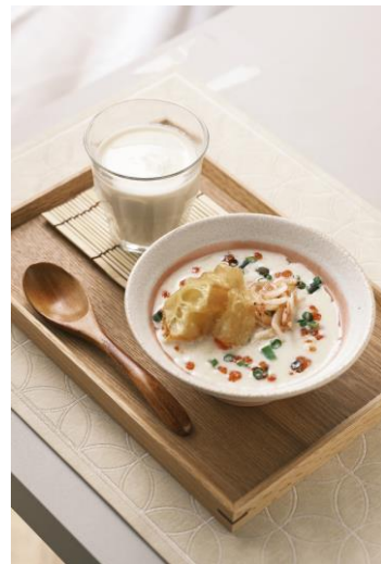
鹹豆漿（シエンドウジャン）