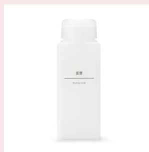
重曹（研磨・消臭）300g 390円（税込）