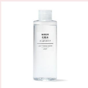
化粧水 敏感肌用 さっぱりタイプ 200mL 580円（税込）