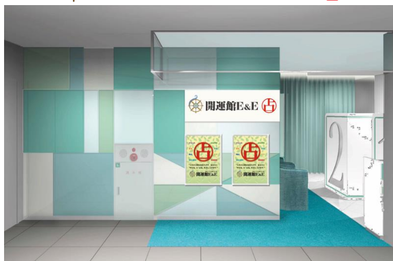
店舗ロゴ・イメージパース